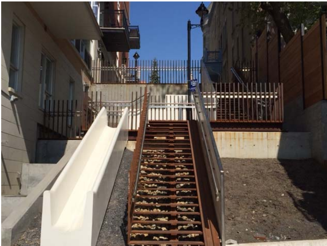
Aménagement vu de la rue Saint-Christophe.