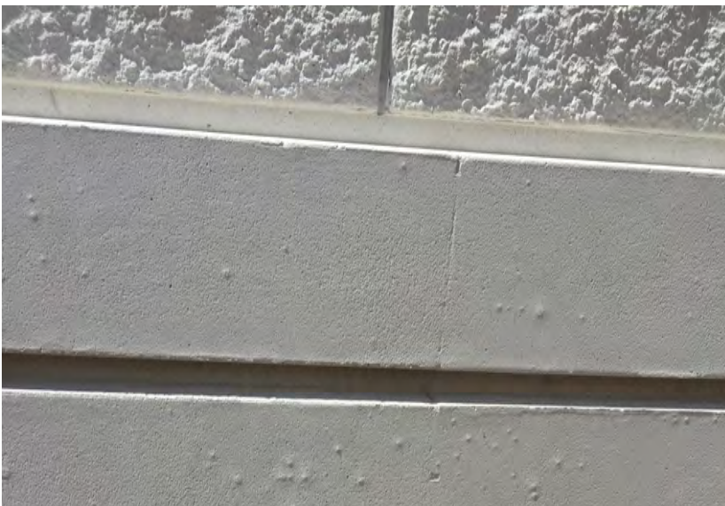
Détail de la texture des surfaces extérieures